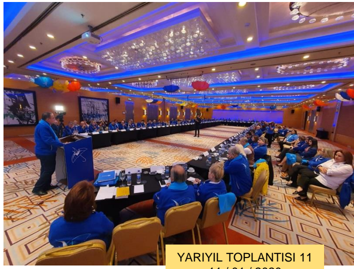
YARIYIL TOPLANTISI 11 11 / 01 / 2020