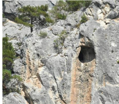
BU KANYON NEREDE ? LÜTFEN İL, İLÇE VE KANYONUN ÜZERİNDE OLUŞTUĞU NEHİR